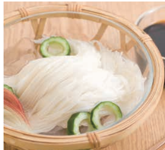
手延べそうめん調理例