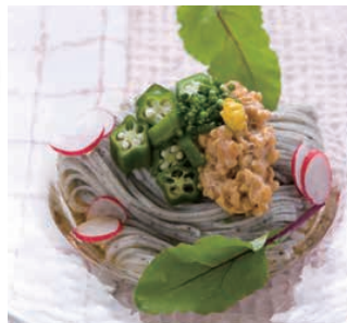
手延べ黒ごま麺調理例