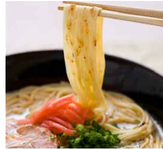
夜鳴きラーメン調理例