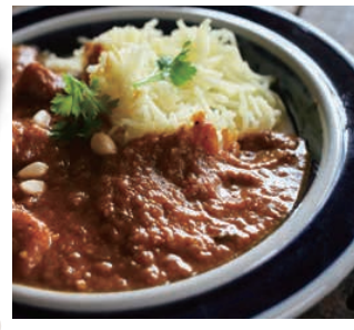
牛すじカレー調理例