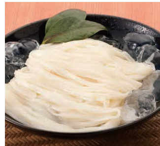
手延べのどごしうどん調理例